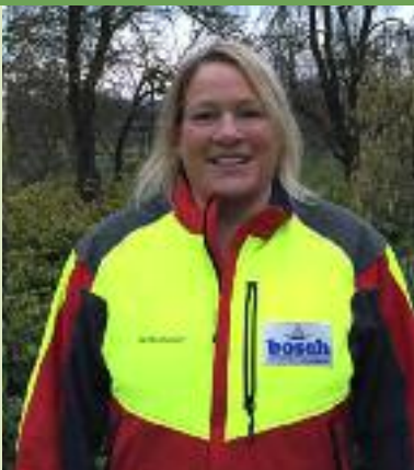
Sandra Göller Organisation und Anmeldung

Wir sind ein Team von engagierten Gattermeistern, mit dem Ziel, Hunde zur effizienten Jagd auf Schwarzwild auszubilden.